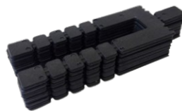
ADSHIM HORSE SHOE SHIM CALE EN FER À CHEVAL