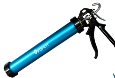
ADSEAL 600MG (600ml)