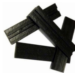
ADSEAL SETTING BLOCK CALES D'ASSISE