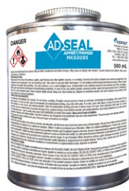
ADSEAL MK60095 PRIMER/APPRÊT