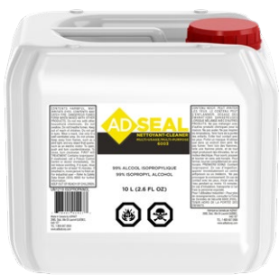
ADSEAL 6003 MULTI-PURPOSE CLEANER NETTOYANT MULTI-SURFACE